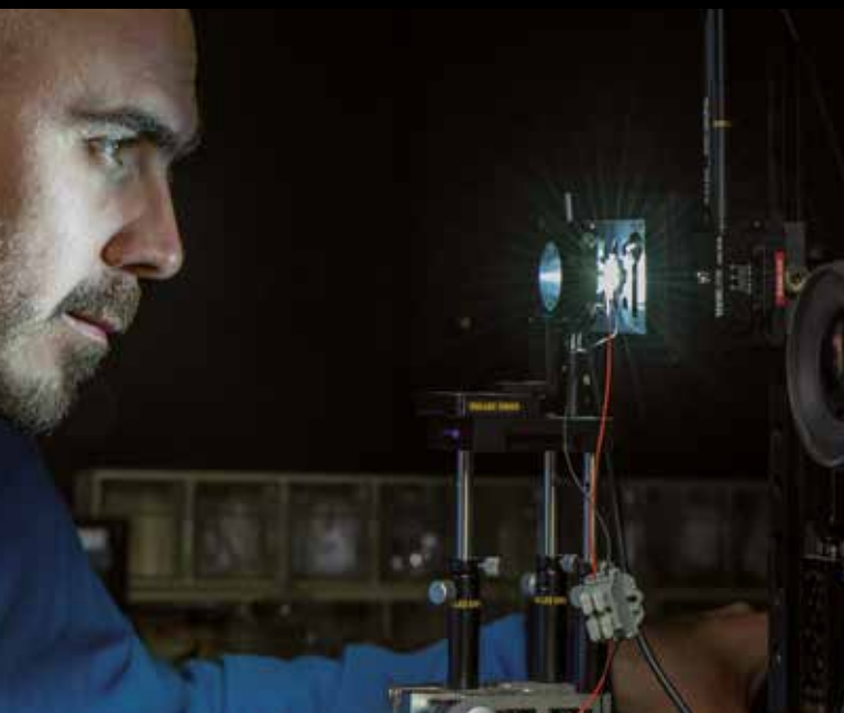
Dział testowy w Crolles, France