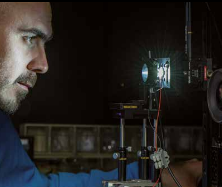
Dział testowy w Crolles, France